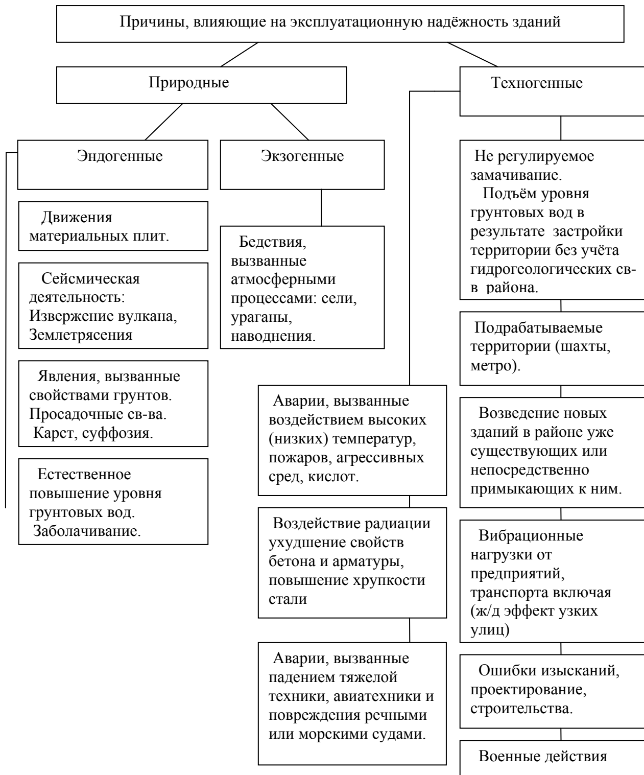
Рис.2.- Блок схема классификации факторов, детерминирующих проявление функции \Omega(t)

представленной на рис.2. По происхождению факторы можно разделить на две основные группы природные и техногенные.