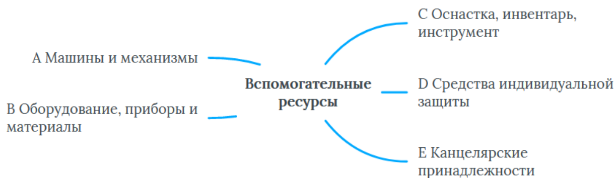
Рис. 1. – Верхний уровень КТ «Вспомогательные ресурсы»

На первом этапе создания КТ «Вспомогательные ресурсы» в качестве базового источника принят классификатор строительных ресурсов, который охватывает только часть вспомогательных ресурсов в виде машин и механизмов. На базе данного классификатора происходило наполнение сущностями класса А «Машины и механизмы». При этом: