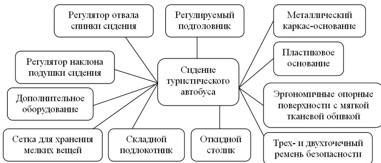
Рис. 9. Структурная схема пассажирского сидения туристического автобуса

Из вышесказанного видно, что от назначения автобуса и условий эксплуатации в значительной степени зависит: набор конструктивных элементов; тип, качество и ценовая категория используемых материалов; сложность конструкции и стоимость пассажирского сидения в целом. В сводной таблице 1 приведены наборы конструктивных элементов в зависимости от назначения и типа автобуса.