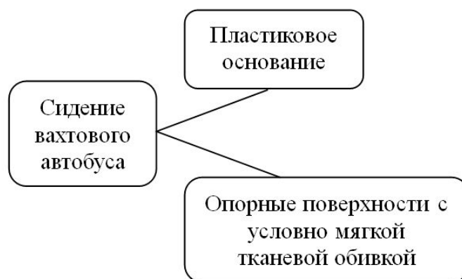
Рис. 3. Структурная схема пассажирского сидения вахтового (вездехода) автобуса