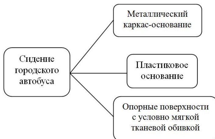
Рис. 5. Структурная схема пассажирского сидения городского автобуса

Перронные автобусы предназначены для перевозки пассажиров на короткие расстояния (обычно в аэропортах между терминалом и самолетом). В силу этой специфики автобусы имеют ряд особенностей для обеспечения максимальной вместимости пассажиров: габаритные размеры отличные от нормативных ( Технический регламент о безопасности колесных транспортных средств ), крайне незначительное количество пассажирских кресел. В таких автобусах могут быть установлены 1-2 пассажирских сидения, схожих по конструкции с сидениями для вахтовых или городских автобусов. Но так как сиденья здесь несут в большей степени декоративную функцию, их дизайн должен быть гармонично вписан в интерьер салона.