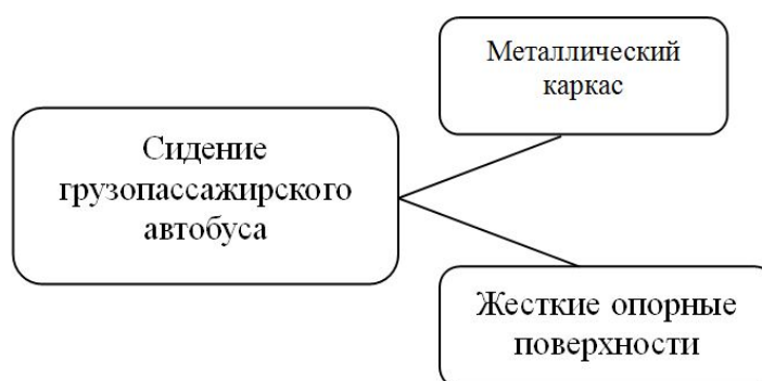
Рис. 4. Структурная схема пассажирского сидения грузопассажирского автобуса

Пассажирские сидения для городских автобусов имеют более сложную, по сравнению с описанной выше, структурную схему (рис. 5). Их конструкция обычно состоит из металлического подрамника, на который устанавливается сиденье, и пластикового каркаса, покрытого декоративной тканью. Такая конструкционная схема, а также особенности дизайна основаны на следующих требованиях: простота установки сидений в автобусе, оптимизации формирования жизненного пространства пассажирского салона, уменьшение массы и стоимости изготовления каждого сиденья и автобуса в целом, обеспечение необходимых эстетических характеристик.