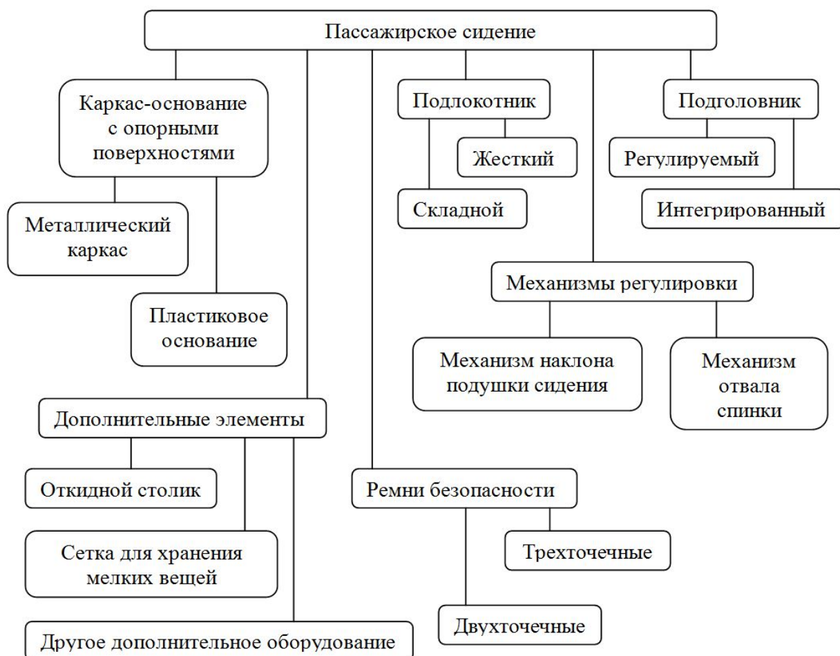
Рис. 2. Структурная схема пассажирского сидения

Анализ показывает, что существуют различные наборы конструктивных элементов, входящих в состав пассажирского сидения автобуса, которые в значительной степени зависят от условий эксплуатации сидения и назначения автобуса.