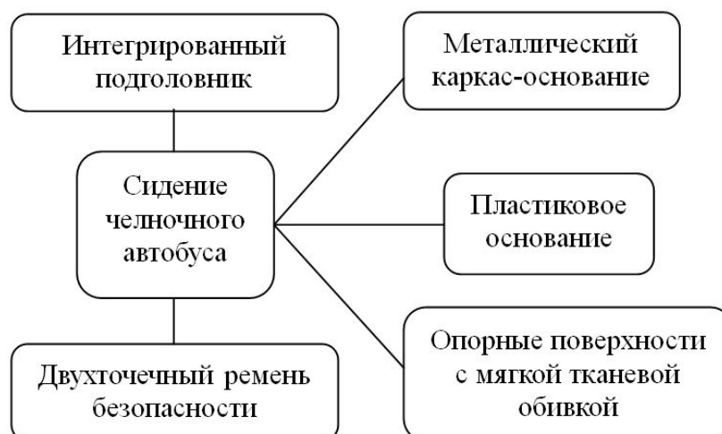
Рис. 7. Структурная схема пассажирского сидения челночного автобуса

На челночных автобусах (рис. 7) устанавливают мягкие сидения на основе жесткого нерегулируемого металлического каркаса с возможностью установки ремней безопасности. В большинстве случаев такие сидения выполняются с интегрированными подголовниками.