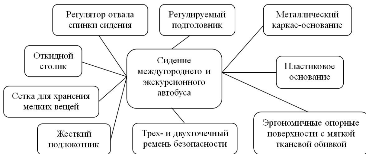
Рис. 8. Структурная схема пассажирского сидения междугородного и экскурсионного автобусов

безопасности, встраиваемые откидные столики и другие дополнительные элементы.