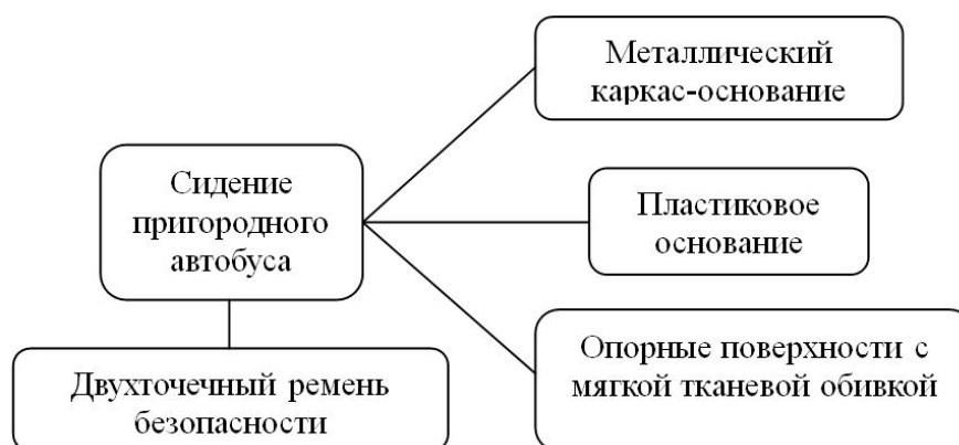
Рис. 6. Структурная схема пассажирского сидения пригородного автобуса

На челночных автобусах (рис. 7) устанавливают мягкие сидения на основе жесткого нерегулируемого металлического каркаса с возможностью установки ремней безопасности. В большинстве случаев такие сидения выполняются с интегрированными подголовниками.