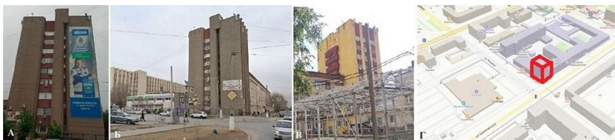
Рис. 1. – корпус «Г» в структуре Ворошиловского кампуса ВолгГТУ. Внешний вид (авторские фотографии): А – 2017 г.; Б – 2021 г.; В – 2024 г.; Г – схема размещения корпуса в планировочной структуре кампуса.

3) Разработано проектное решение трансформации фасада, выбранного экспериментального объекта, демонстрирующее возможности использования на практике выделенных эстетических и информативных качеств. На рисунке 1 представлены: градостроительная ситуация, размещения корпуса «Г» ВолгГТУ в структуре Ворошиловского кампуса, внешний облик главного фасада в разные годы.