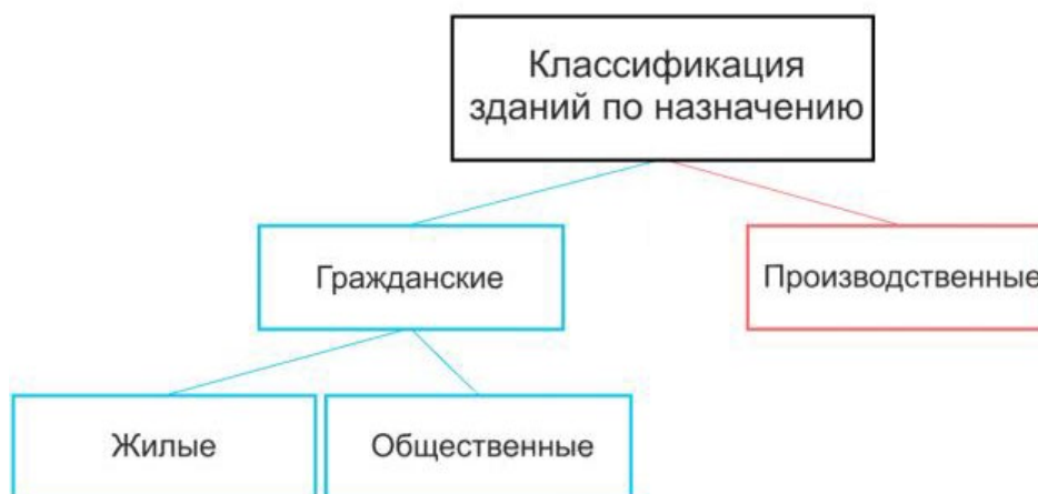
Рис.1. – Классификация зданий по функциональному назначению

Общественные здания предусмотрены для удовлетворения социальных, культурных, образовательных, медицинских и административных потребностей населения. Для общественных зданий можно выделить следующие функции: административная, образовательная, здравоохранительная, культурно-досуговая, спортивная, религиозная, торговая и сервисного обслуживания.