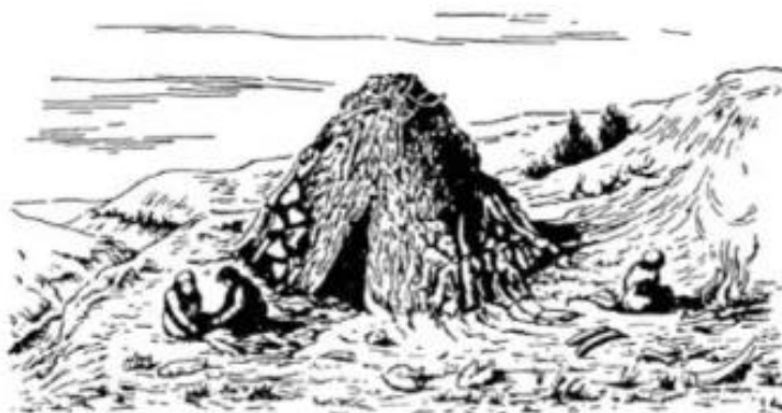
Рис.2. – Жилище эпохи палеолита [4]

появлением первых жилищ, которые начали возводить неандертальцы. Основным поводом такого строительства послужило глобальное похолодание, вызвавшее необходимость в создании постоянных жилищ [4]. Таким образом, в эпоху палеолита сформировалась жилая функция, суть которой заключалась в защите древних людей от диких зверей и природных явлений, а архитектурное решение проявлялось в виде примитивной конструкции из подобия стен и кровли над головой (рис.2). Данная концепция легла в основу архитектуры всех последующих исторических периодов и архитектурных стилей, и находит широкое применение по сегодняшний день.