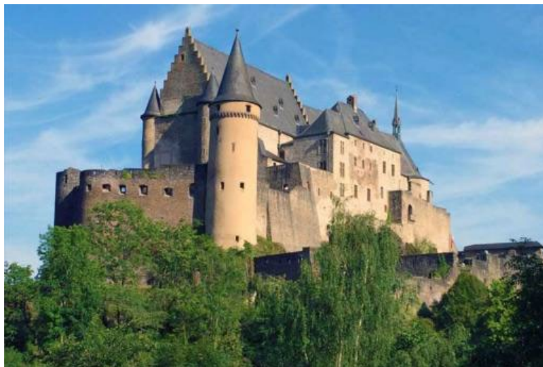
Рис.5. – Пример феодального замка (замок Вианден, Франция) [10]

образом, архитектура средневековых зданий сложилась как результат сложного взаимодействия религиозных верований, региональных особенностей и необходимостью в постоянной обороне.