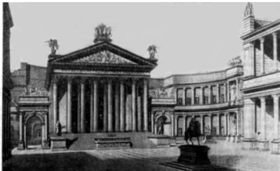
Рис.4. – Древнеримский форум [7]

За древнегреческим периодом последовала эпоха Древнего Рима (VI в. до н.э. – V в. н.э.), скопировавшая и усовершенствовавшая большинство типов зданий Древней Греции. Жилую функцию стали выполнять домусы, таберны, виллы, а также инсулы – первые многоэтажные многоквартирные дома. Важнейшее значение в эпоху Древнего Рима занял форум (рис. 4) – площадь, объединившая культурно-досуговую, административную, торговую, спортивную и религиозную функции. Таким образом, влияние функций зданий на архитектуру Древнего Рима заключалось в стремлении продемонстрировать величие и могущество Рима и одновременно улучшить жизнь своих сограждан, что привело к совершенствованию типологии зданий, сформировавшейся в Древней Греции, появлению многоквартирных домов в связи с ростом населения и увеличением плотности застройки, а также возникновению форумов – площадей, объединявших несколько общественных функций.