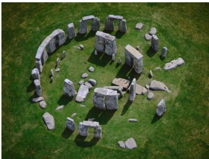
Рис.3. – Стоунхендж [6]

сооружением бронзового века является Стоунхендж (рис.3) – по сути, первый храм в истории человечества [4]. В дальнейшем концепция, примененная в Стоунхендже, легла в основу религиозной функции и сохраняет свои характеристики по сей день в современных храмах и соборах.