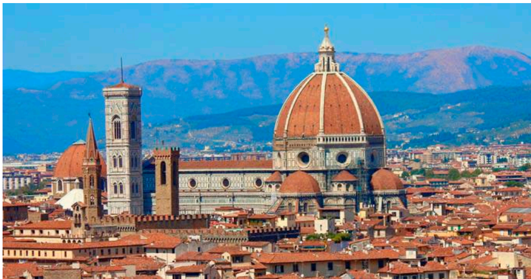
Рис.6. – Архитектура соборов Нового времени (Санта-Мария-дель-Фьоре, Италия) [11]

В целом период Нового времени можно описать уменьшением воздействия церкви на общественные функции, индивидуальным подходом к проектированию зданий и стремлением человека к личностному росту и познанию мира, что напрямую отразилось в планировочных и стилистических решениях, а также в появлении новых архитектурных объектов.