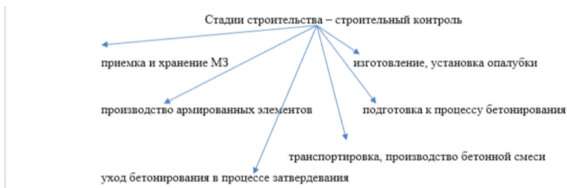
Рис.2 - Схема стадий строительства в процессе проведения контроля

Контроль качества бетонных и железобетонных конструкций выступает одним из эффективно развивающихся направлений строительного контроля. Данные проверки включают определение качества материальных запасов (далее МЗ), используемых в процессе строительства и процессы следования технологиям в соответствии с установленными регламентами. Этапы строительства при осуществлении строительного контроля представлены на рис.2 [4, 5,]: