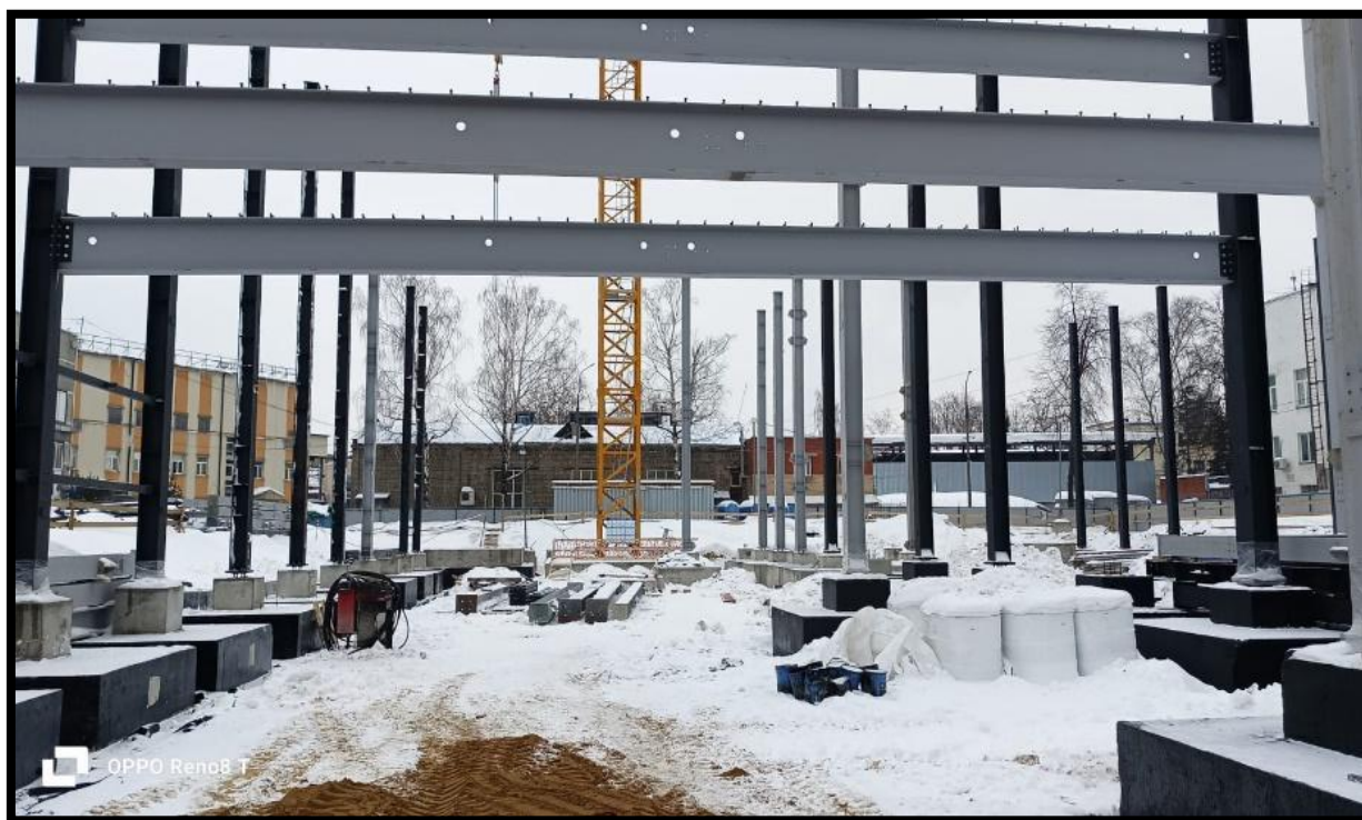
Рис. 5. – Ростверки и колонны

A500 диаметром 18 мм, также перед заливкой ростверка монтируются закладные под монтаж железной колонны. Завершающим этапом работ по фундаменту на основе свайного поля являются работы по бетонированию ростверков (будущие фундаменты железных колон строения), впоследствии на них монтируются железные колонны будущего паркинга (рис. 5). Заливка бетоном производилась в два этапа маркой бетона В30 на граните, далее осуществлялась изоляция битумной мастикой в два слоя и монтаж мембраны. Работы по бетонированию ростверков на представленном в статье здании парковки проводились в зимний период, для прогрева бетона использовались генераторы и греющий кабель. До начала работ по защите бетона изоляцией необходимо сделать испытания бетона, первое испытание делается по истечению 7 суток с момента заливки, второе – 28 суток.