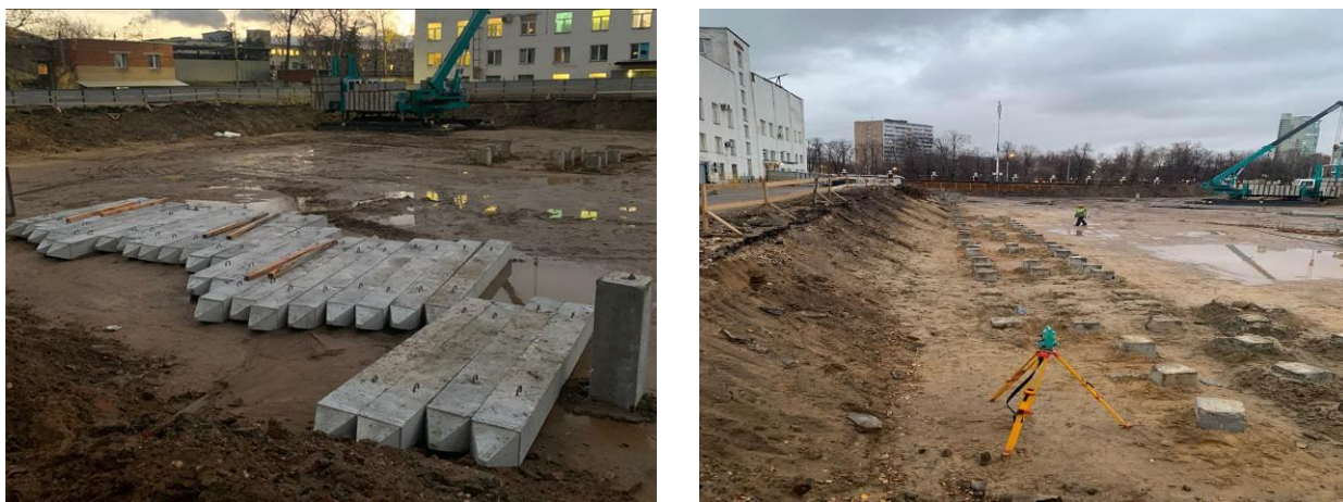
Рис. 3. – Железобетонные балки

Для строительства рассматриваемого здания использовались железобетонные сваи от 4 до 13 метров длиной (рис. 3). Подбор свай определяется проектом под нагрузку несущей/не несущей балки [7-9].