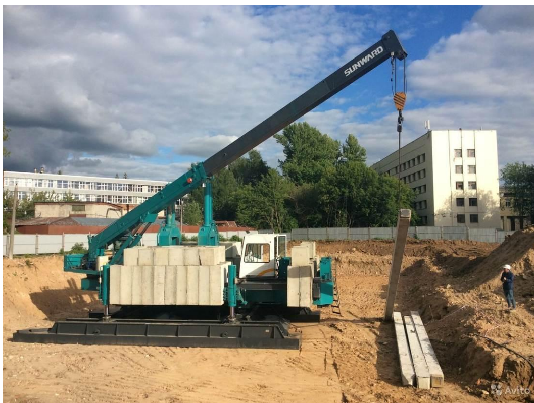
Рис. 4. – Установка «Sunward ZYJ 360»

До начала массового устройства необходимо выполнить контрольные испытания свай вдавливающей статической нагрузкой для подтверждения принятой в проекте несущей способности. Испытание необходимо проводить после вдавливания по прошествии 7-14 дней. Помимо испытаний перед началом массового вдавливания, выборочно проводятся испытания после окончания. Нагрузка на испытываемую сваю создаётся гидравлическим домкратом с насосной станцией и манометром. На рис. 4, где представлена установка, свая проходит испытание. Если присмотреться, можно увидеть на свае установленный домкрат. Нагрузка на 4-х метровую сваю составляет 52 тонны, на 13-ти метровую – 86 тонн. Данные по нагрузкам для испытаний рассчитывает проектный институт.