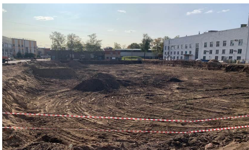
Рис. 2. – Разработка котлована

Перед началом разработки котлована будущего фундамента здания необходимо определить наличие подземных коммуникаций, в случае их наличия предусмотреть их вынос из зоны застройки. Раскопка котлована ведётся до необходимой высотной отметки с сохранением твёрдого тела земли, в случае перекопа необходимо подсыпать только песок и уплотнять до коэффициента 0,98%, процесс разработки котлована ведётся под постоянным геодезическим контролем [5, 6]. В нашем случае в некоторых местах парковка имеет относительную отметку -0,550, поэтому проектное решение выполнялась раскопка котлована (рис. 2).