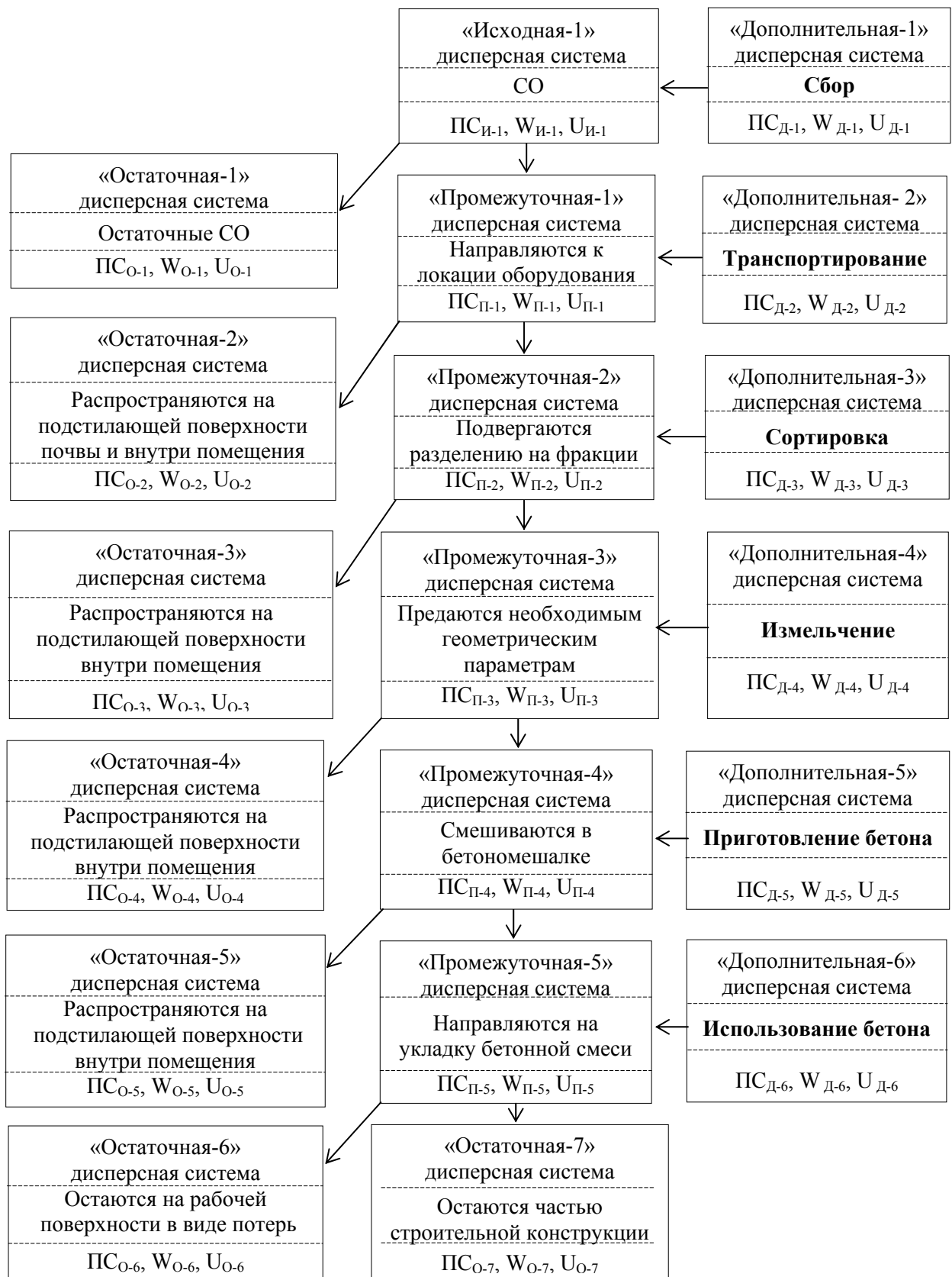
Рис. 2. – Блок-схема физической модели процесса уменьшения поступления строительных отходов в ОС системы ВТСЗ