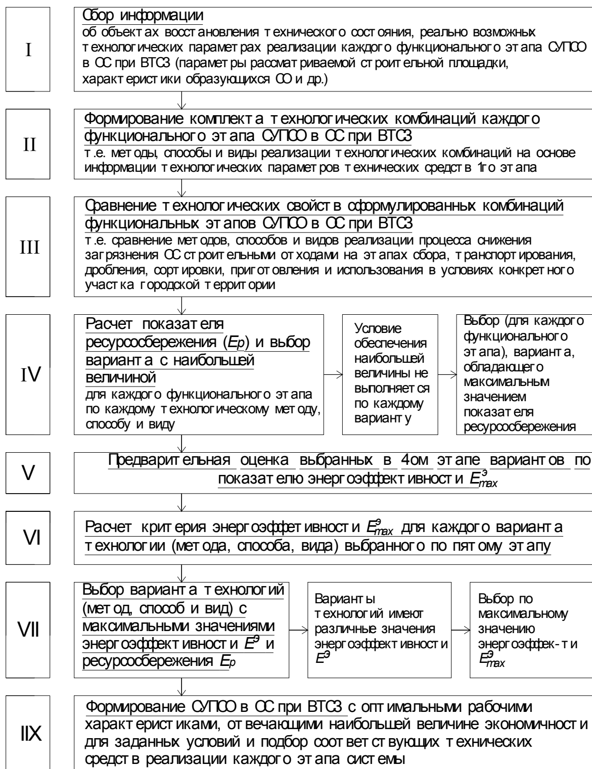
Рис. 3. – Блок-схема реализации методики снижения загрязнения ОС системы восстановления технического состояния зданий

Практическая апробация методики показала, что возможный эколого-экономический эффект составляет от 112 до 229 тыс. руб., а её внедрение для городской застройки позволит обеспечить экологическую безопасность.