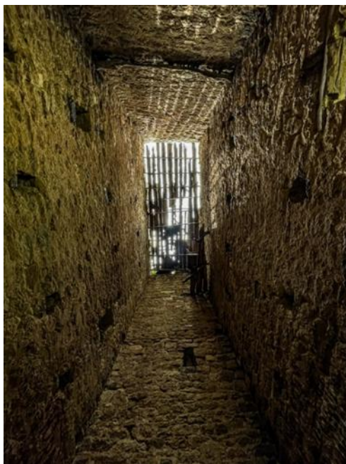
Рис. 3. – Башня Адиюх изнутри

По гнездам сгнивших бревен, служивших междуэтажными перекрытиями (по шесть с западной и восточной стороны), можно определить количество этажей – здесь их было пять (рис. 3). Первый этаж, глухой, без проемов, достигал в высоту приблизительно 1,70 м. Вход доступен только через второй этаж по лестнице, которую спускали оттуда наружу через отверстие. Однако сейчас оказаться на первом этаже сравнительно легко – можно зайти через пролом в юго-западном углу. На этом этаже хранили воду и пищу при осаде башни, а также там содержали пленников. Пол, устланный землей вперемешку с щебнем, местами дает оседание, иногда при простукивании выказывает пустоты ниже почвенного уровня.