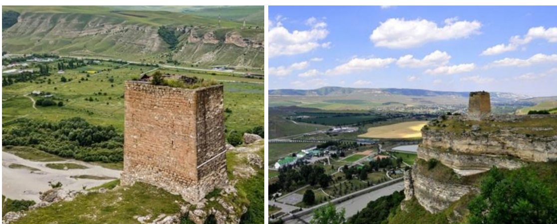
Рис. 1. – Сторожевая башня Адиюх в настоящее время

Являясь единственным сохранившимся памятником в одноимённом городище, башня возвышается над излучиной реки Малый Зеленчук.