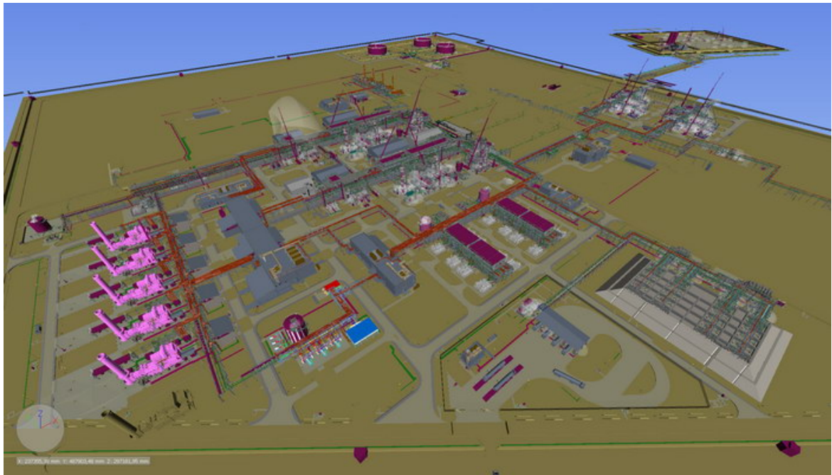
Рис. 3. – Завершено проектирование всех технологических блоков (готовность 98%)

При «выходе» проекта в стадию реализации была создана собственная система документооборота «Армадо». Программа позволяет любому специалисту, задействованному в проекте (с соответствующим уровнем доступа) загружать документы на персональный компьютер или планшет и контролировать как качество проектных решений на стадии проектирования, так и сам процесс реализации в соответствии с последней версией документа (а при необходимости — и предыдущей версии). Изометрические чертежи попадали в цеха укрупнительной сборки на завод в Корею, что позволило до 60% конструкций доставить на площадку в укрупнено-блочном исполнении. Данный принцип ведения работ позволил решить проблему с отсутствием квалифицированных сварщиков в регионе строительства.