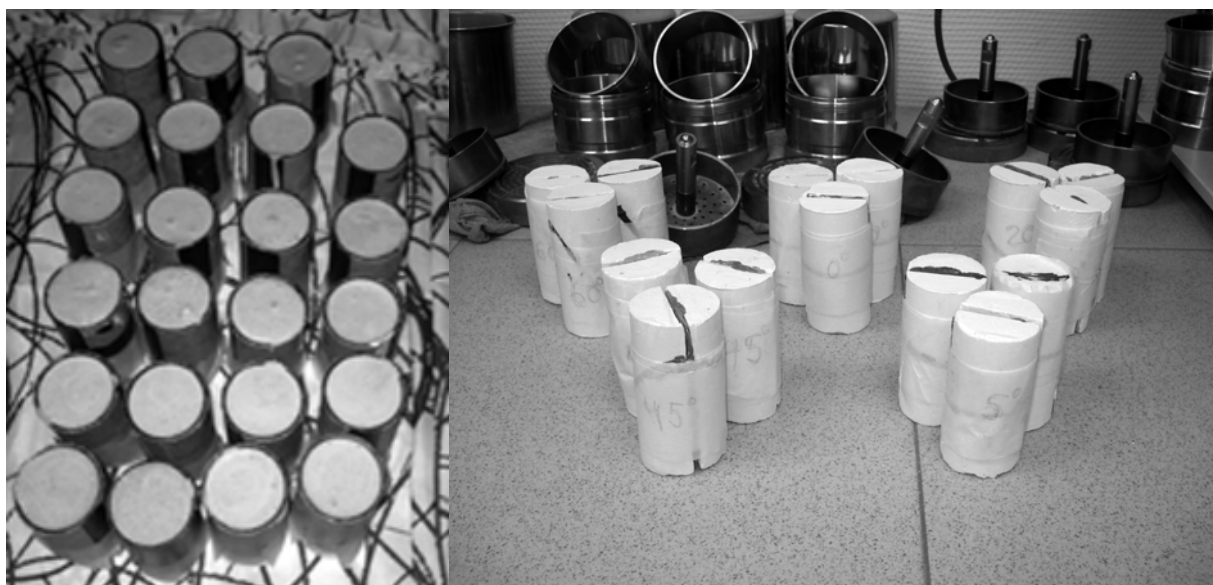
Рис.2. — Подготовленные модели для физического моделирования