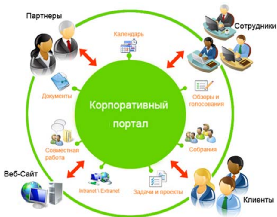
Рис. 1. Возможности корпоративного портала

Таким образом, формирование единого пользовательского интерфейса – это лишь частная и далеко не самая главная задача для корпоративных порталов. Гораздо важнее тут стоит проблема упорядочивания внутренней структуры КИС.