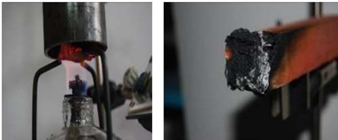
Рис. 3. – Испытания в установке «Огневая труба»

Разработанный авторами статьи состав модификатора на основе водорастворимых полимеров обеспечивает пожаростойкость I группы, потеря массы не превышает 9% (рис.3).