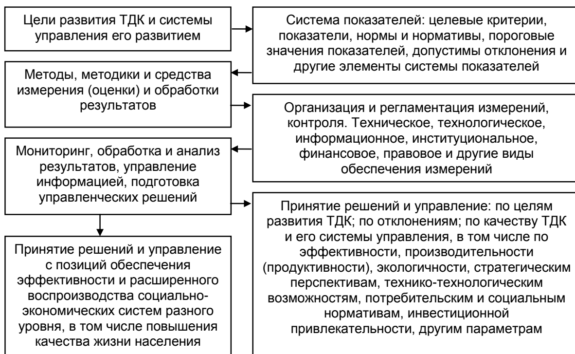
Рисунок 1 – Алгоритм построения согласованного стратегического и операционного контроллинга

С методологических позиций построение контроллинга стратегии и политики развития ТДК возможно при использовании системного, комплексного, процессно-функционального и синергетического подходов.